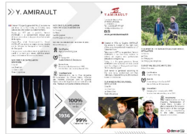
Format numérique 1 page - français/anglais